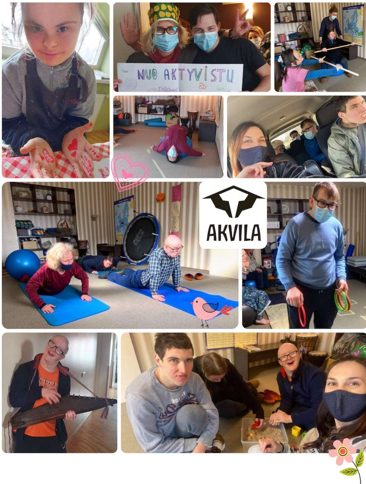
DIENOS CENTRO "AKVILA" TERAPIJŲ VEIKLOS