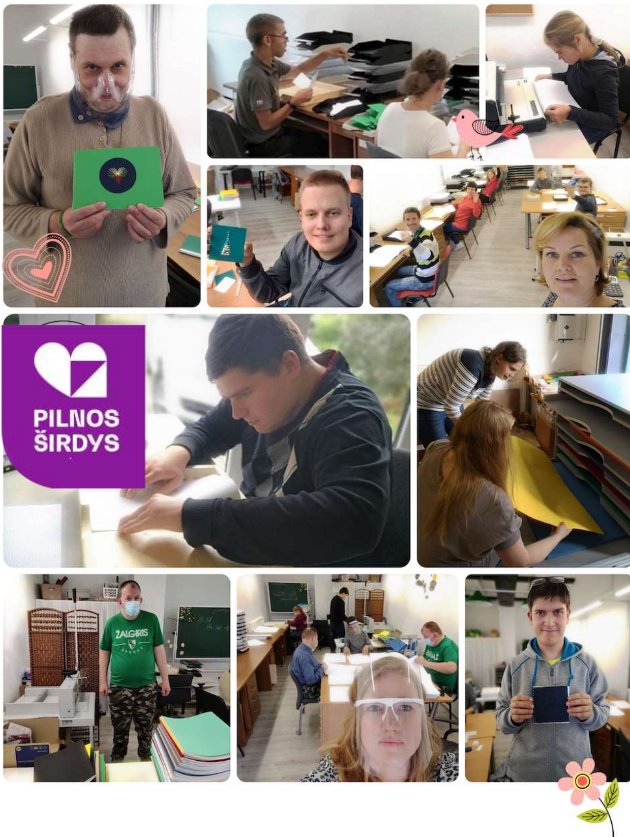
SOCIALINĒS DIRBTUVĒS "PILNOS ŠIRDYS"