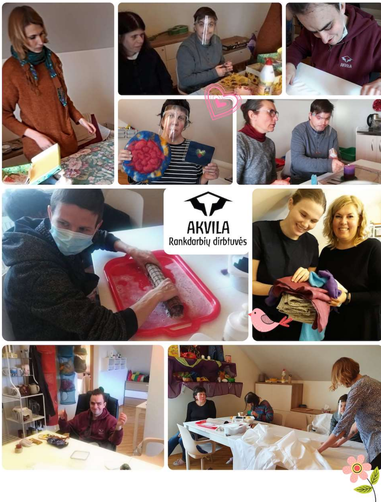
DIENOS CENTRO "AKVILA" RANKDARBIŲ DIRBTUVĒS