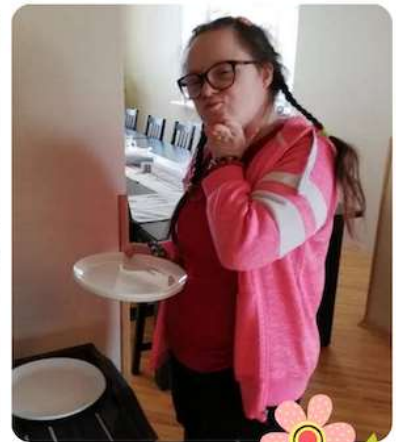
DIENOS CENTRO "AKVILA" VIRTUVĒS DIRBTUVĒS