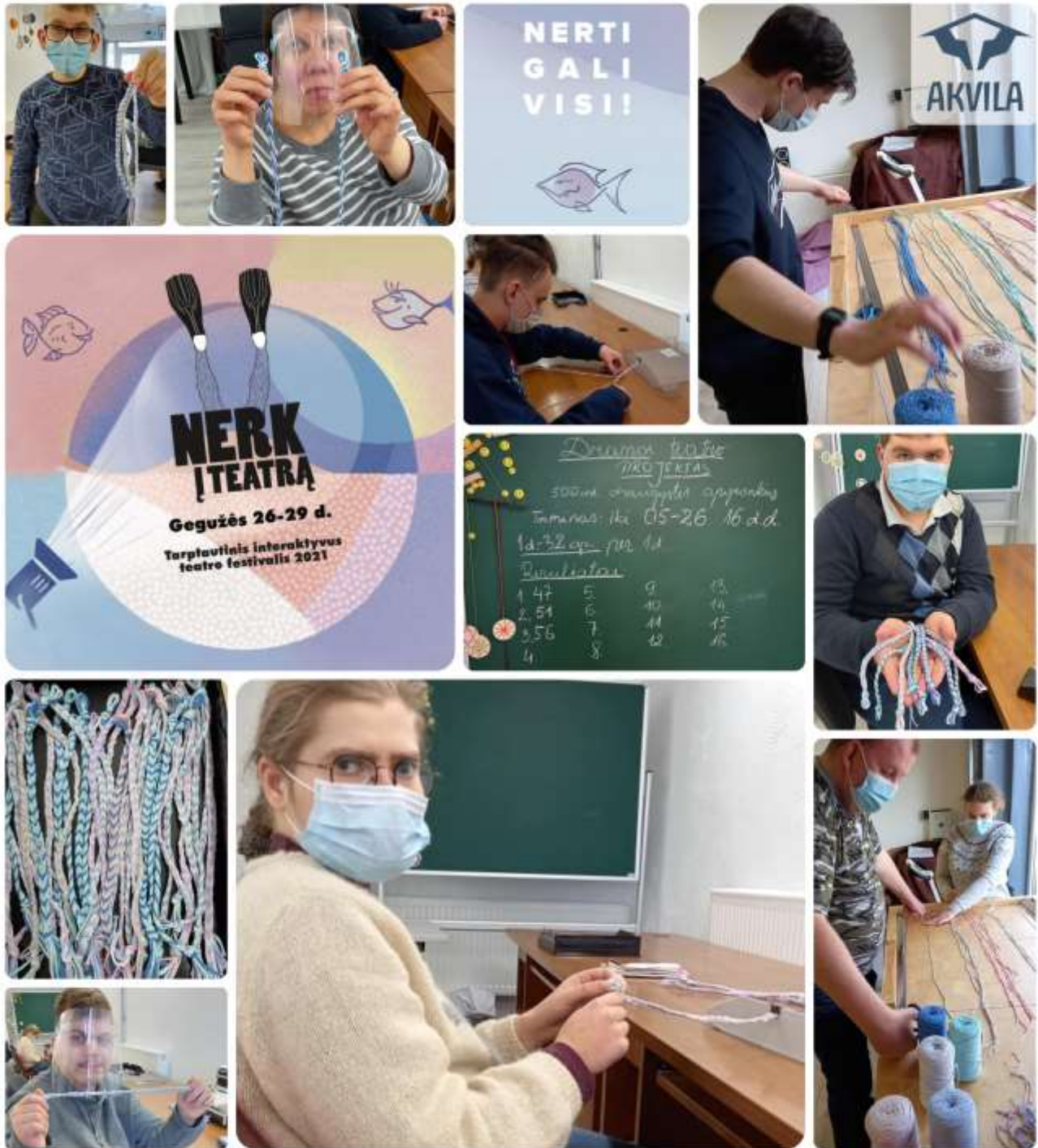
SOCIALINIŲ DIRBTUVIŲ PROJEKTAS SU VALSTYBINIU KAUNO DRAMOS TEATRU